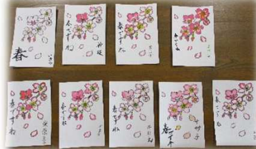
絵はがきでさくらが満開に咲きました