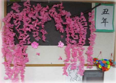
壁の装飾づくりで製作したしだれ桜

今年の春は例年よりも早く春の訪れが感じられました。外出はできませんが、皆様には春を感じてもらえるような活動を行いました。