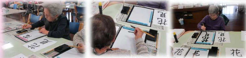
書道では皆さん真剣に春にちなんだ言葉を書きました。

ちょっと殺風景だったサンビラに皆さんでお花を植えて頂きました。色合いなどを考えて植えてくださいました。最後の片づけまでしっかりと行ってくださいました。