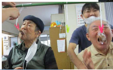
パン食い競争ならぬ、おやつ食い