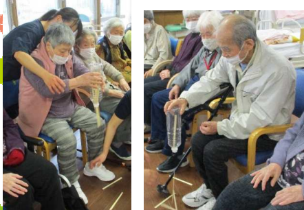
割りばしジャラジャラポン