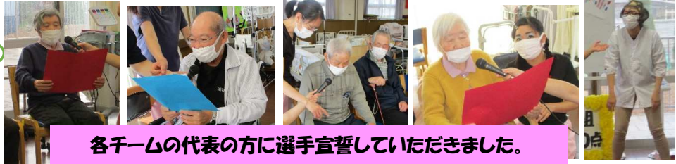
各チームの代表の方に選手宣誓していただきました。

運動会では、日替わりで 3種類の種目を行いました。 初めて行う種目も ありましたが、みなさん 手際よく行われていました。