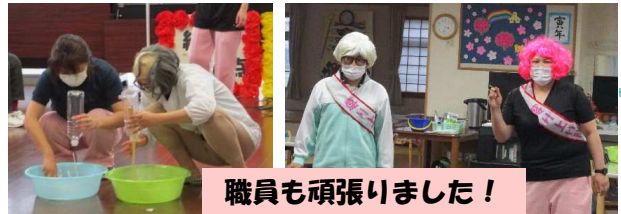
職員も頑張りました!